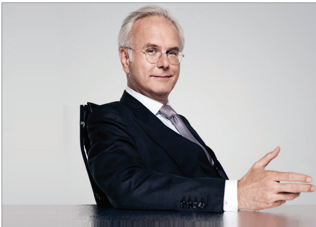
TV-Entertainer Harald Schmidt

Auf Einladung des Vereins „Stadtgespräch e.V.“ findet am Montag, 29. September 2014, um 19 Uhr, in der Festhalle Düren-Birkesdorf eine bemerkenswerte Veranstaltung statt: Ulrich Grillo, Präsident des Bundesverbandes der Deutschen Industrie (BDI), diskutiert mit TV-Entertainer Harald Schmidt über das Thema „Ein Jahr Große Koalition – Aufbruch oder Tiefschlaf für Deutschland?“.