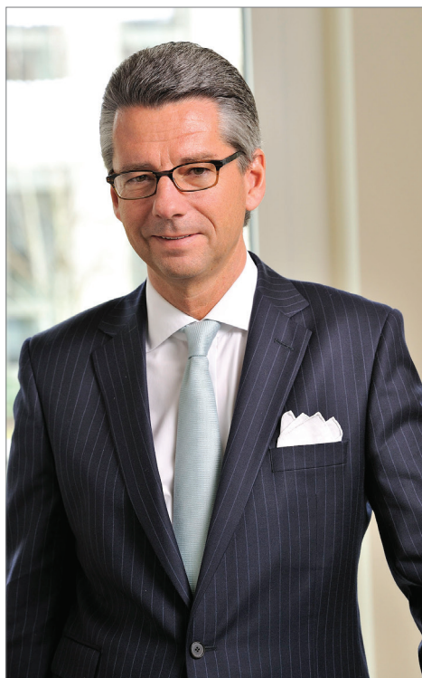
BDI-Präsident Ulrich Grillo