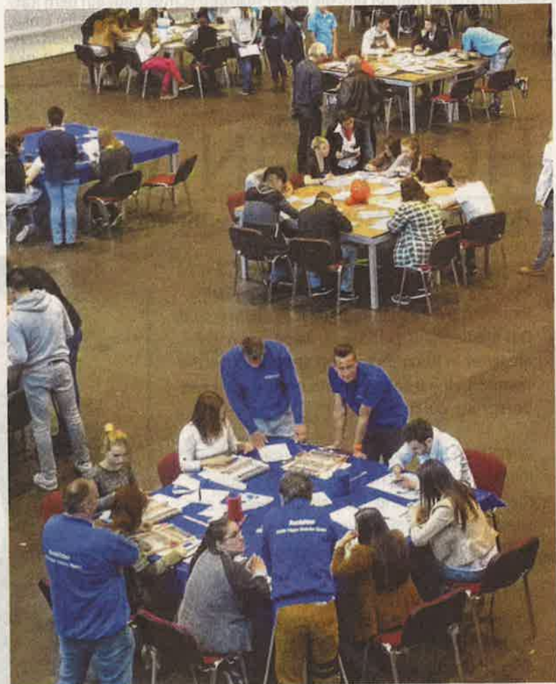
Rund 500 Jugendliche aus acht Schulen bekamen in der Arena Kreis Düren von 13 Unternehmen einen Einblick in 16 Berufe geboten.

rufe mit den Schulnoten von eins bis sechs, je nach persönlichem Interesse, bewerten und auf diese Art und Weise einen Grundstein für die Findung einer weiteren Berufsausbildung legen. (jof)