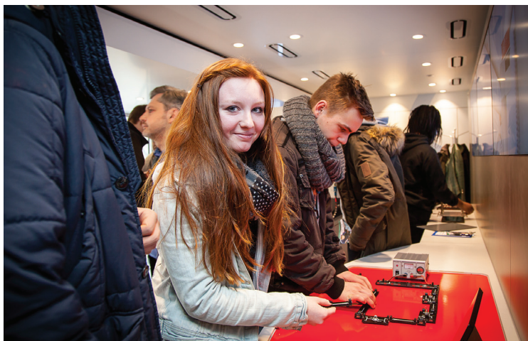
Der InfoTruck will auch Mädchen mit technischen Berufsbildern vertraut machen.

Der Einsatz ist für die Schulen kostenfrei. Zwei erfahrene pädagogische Betreuer begleiten die Schulklassen und ihre Lehrer während des Besuchs im InfoTruck.