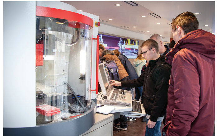
Im InfoTruck dürfen die Jugendlichen unter Anleitung eine computergesteuerte CNC-Fräsmaschine programmieren und ein Werkstück selbst fertigen.