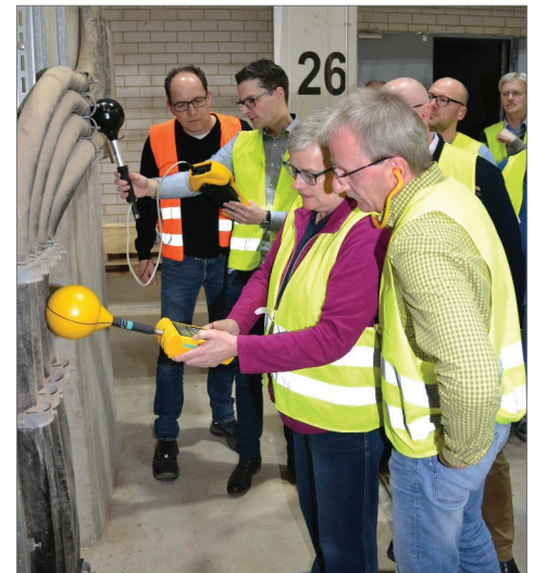
Übung zur Messung von elektromagnetischen Feldern

Neben Kenntnissen der gesetzlichen Regelungen liegt das Hauptaugenmerk bei der Gefährdungsbeurteilung. Sind alle Punkte individuell abgearbeitet, und wenn nötig entsprechende Maßnahmen abgeleitet, kann ein betroffener Mitarbeiter seine Tätigkeiten auch zukünftig durchführen. (Zi)