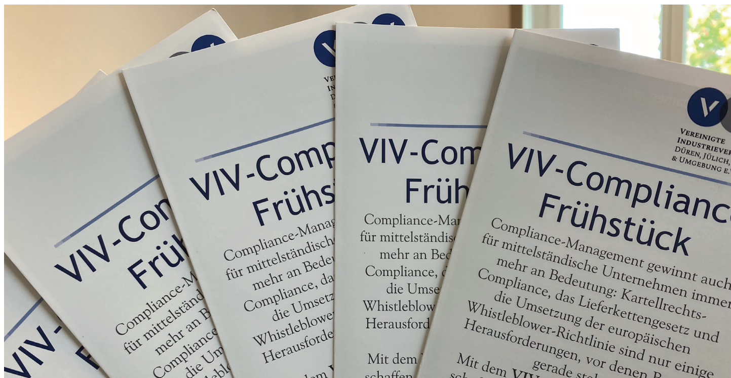
Forum und fachlicher Austausch: Am 13. Mai startet im Haus der Industrie das VIV-Compliance Frühstück.